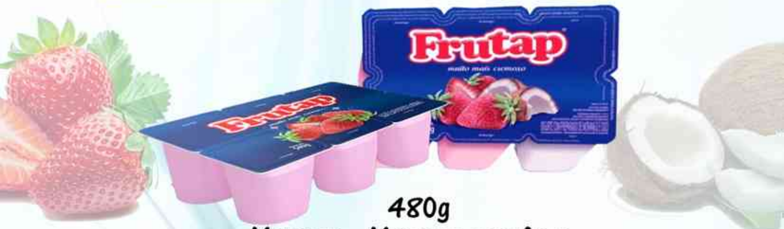
480g Morango - Morango com Coco