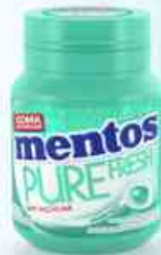
56g Garrafa Wintergreen