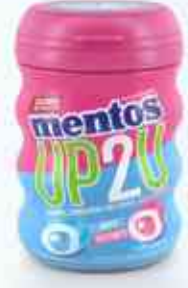
56g Garrafa UP2U Tutti Fruit e Mint