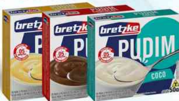
50g Baunilha - Chocolate - Coco