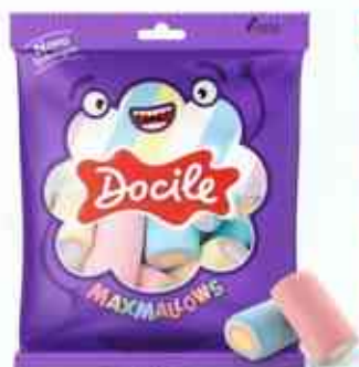
50g Tubo Color