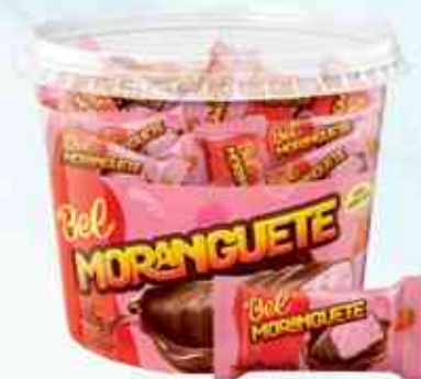
450g 9g Moranguete Pote