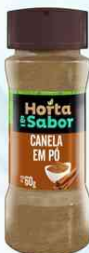
60g Canela em Pó