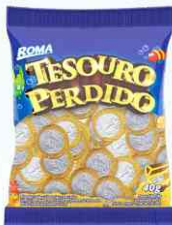
40g Moedas Tesouro Perdido