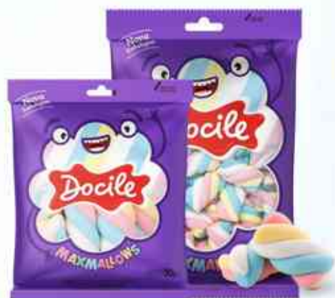
50g 250g Twist Color 1