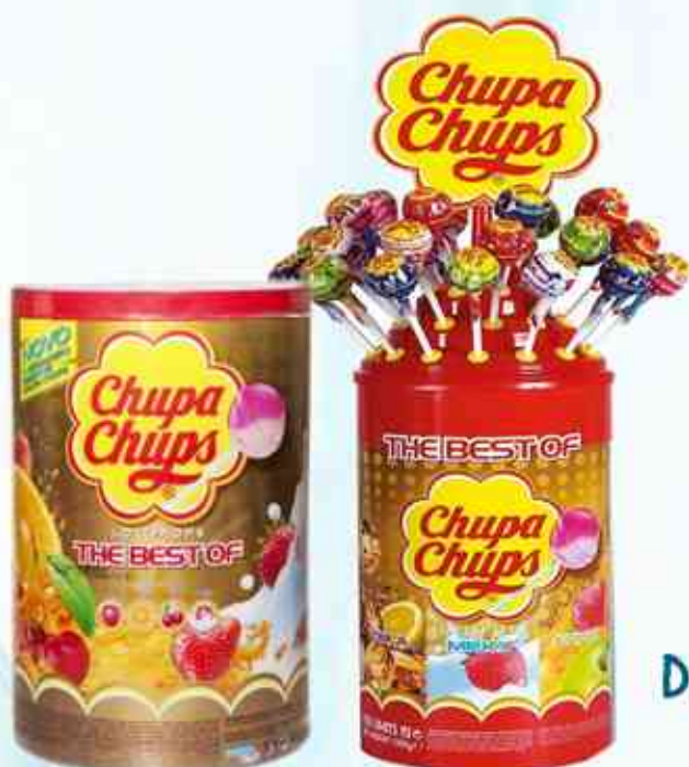
Pirulito 12g Frutas e Creme