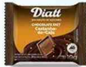
Tablete Mini - 10g Chocolate com Catanha de Caju