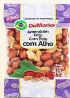
50g Com Pele e Alho