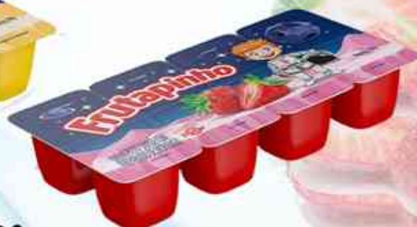
320g Banana - Morango