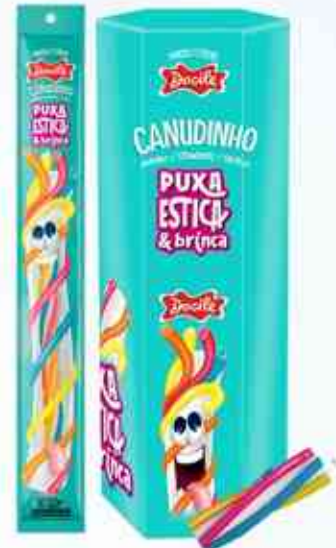
12g Puxa Estica