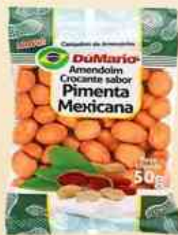
50g Pimenta Mexicana