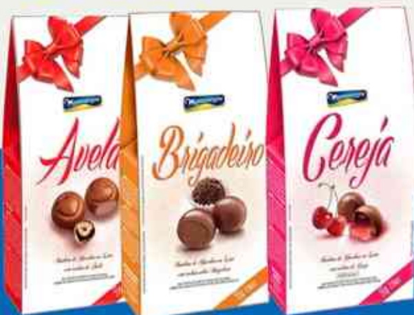
55g Avelã - Brigadeiro - Cereja