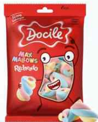
220g Twist Color Recheado