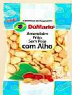
50g - 150g Sem Pele e Alho