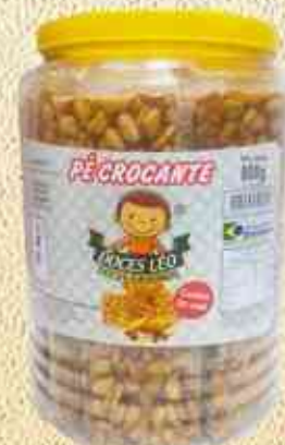
800g Pé Crocante - Pote