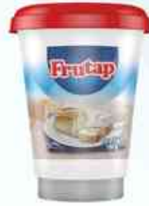
180g Requeijão e Amido