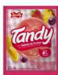
25g Salada de Frutas