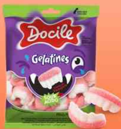
GELATINES Dentes de Vampiro Cítrico