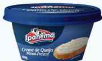
180g Minas Frescal