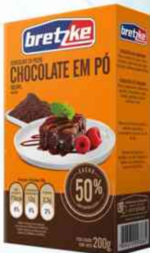
200g Chocolate em Pó - 50%