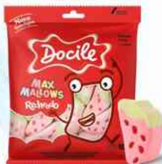
50g Morango Recheado