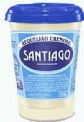
220g Copo de Plástico