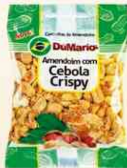
50g - 150g Cebola Crispy