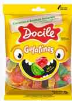
80g Mix de Frutas