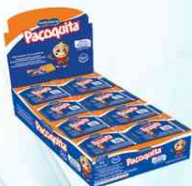
432g (24 unidades) Paçoca Quadrada Zero