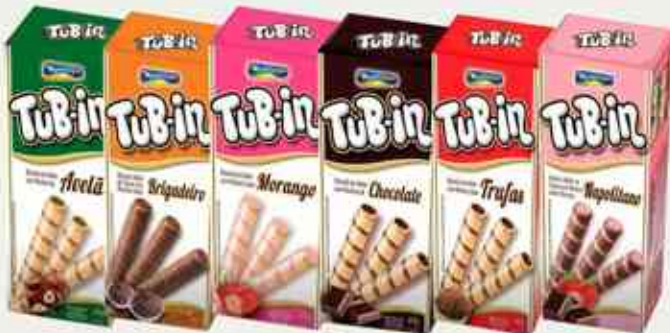
48g Avelã - Brigadeiro - Morango - Chocolate Trufas - Napolitano