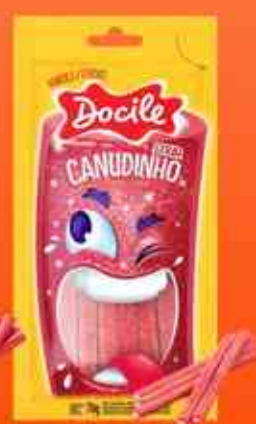
CANUDINHO Morango Cítrico