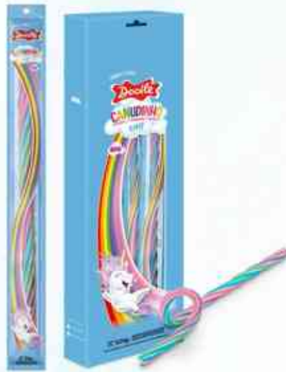
26g Big Unicórnio