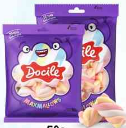
50g Twist Color 2