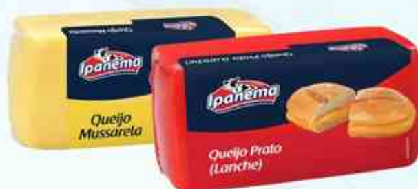
Mussarela - Prato