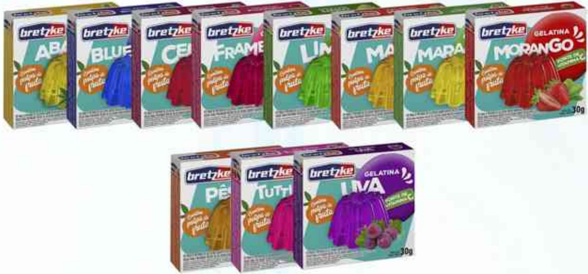
30g Abacaxi - Blueberry - Cereja - Framboesa - Limão Manga - Maracujá - Morango - Pêssego - Tutti-Frutti - Uva