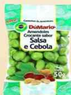
50g Salsa e Cebola