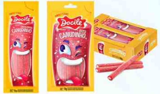
15g 70g Morango Cítrico