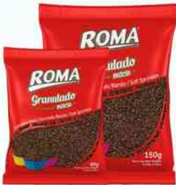
80g 150g Ao Leite