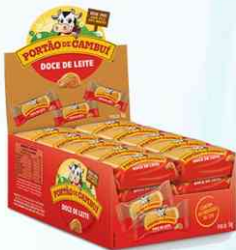
Tradicional 1Kg (40 unidades)