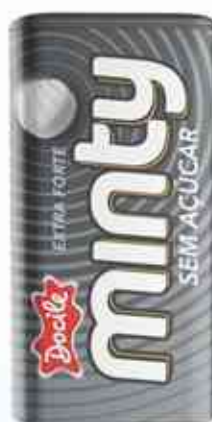
21g Extra Forte