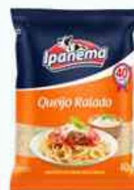
40g Queijo Ralado