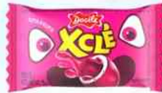
5g Tutti - Frutti