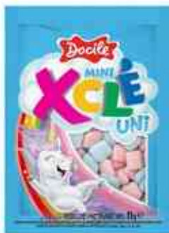
11g Mini Unicórnio