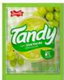
25g Uva Verde