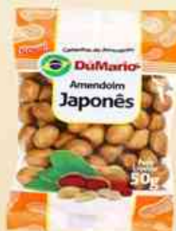
50g - 150g Japonês