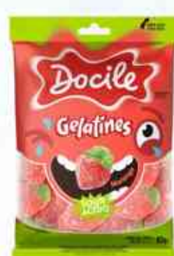
80g Morango Cítrico