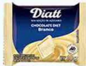
Tablete Mini - 10g Chocolate Branco