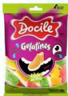
80g Tênis Cítricos