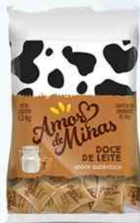
Tradicional Pastoso 1,5Kg (50 unidades)