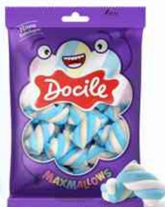
250g Twist Azul e Branco