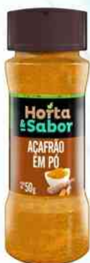
50g Açafrão em Pó