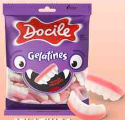
GELATINES Dentes de Vampiro