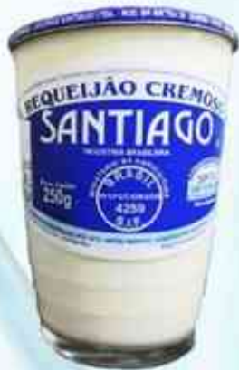
250g Copo de Vidro