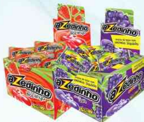
40 unidades Morango - Uva