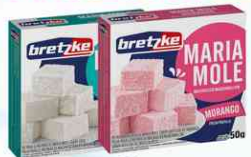
50g Coco - Morango