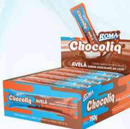
15g Bisnaga Cremosa Avelã