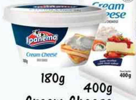
180g 400g Cream Cheese