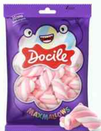
250g Twist Rosa e Branco