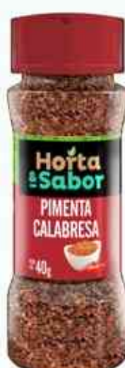
40g Pimenta Calabresa