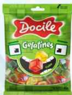
80g Cubo Sortido