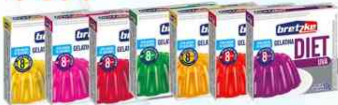
10g Abacaxi - Cereja - Framboesa Limão - Maracujá - Morango - Uva