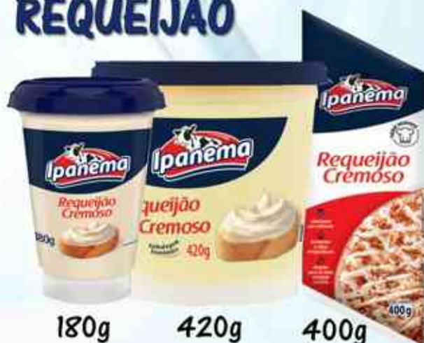
180g 420g 400g Tradicional