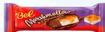
30g Marshmallow com Amendoim