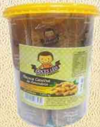
1.050kg Paçoca Quadrada - Pote