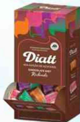
420g Bombom Diatt Misto