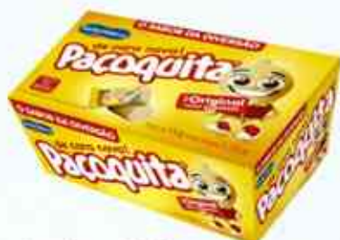
150g (10 unidades) Paçoca Rolha