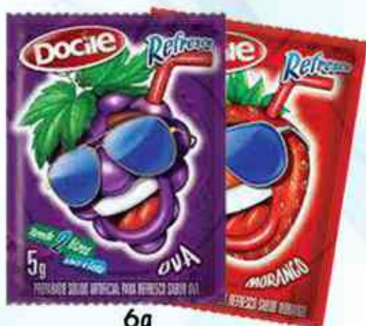
6g Uva - Morango