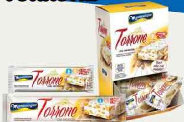
45g 90g 300g Amendoim