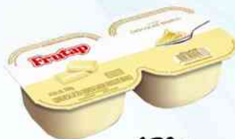
180g Chocolate Branco