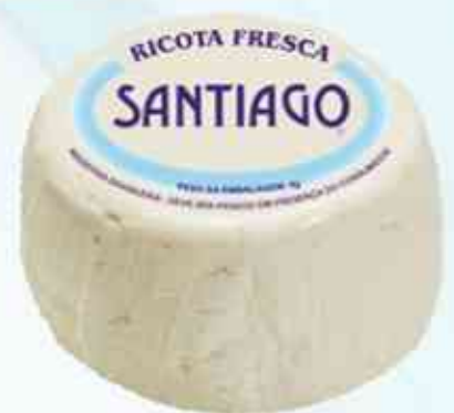
380g Ricota Fresca