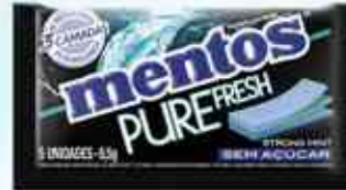
8,5g Strong Mint