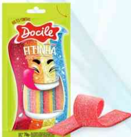
70g Morango Cítrico Colorida