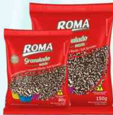
80g 150g Mesclado