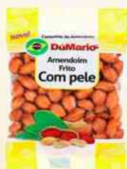
50g - 150g Com Pele