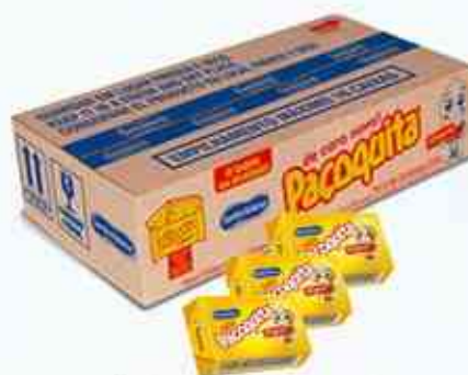
18g (100 unidades) Paçoca Quadrada