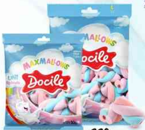
50g 220g Unicórnio Recheado