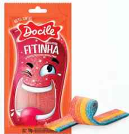
70g Morango Cítrico