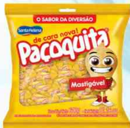
600g Bala Mastigável