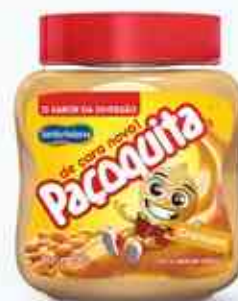
150g Paçoca Cremosa