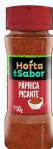
50g Páprica Picante