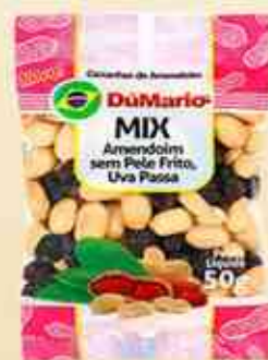
50g - 150g Mix Uva Passa