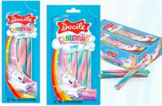
15g 70g Unicórnio