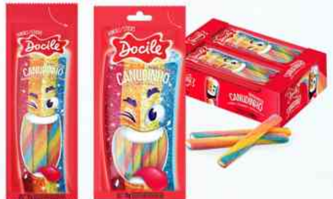
15g 70g Colorido Morango Cítrico