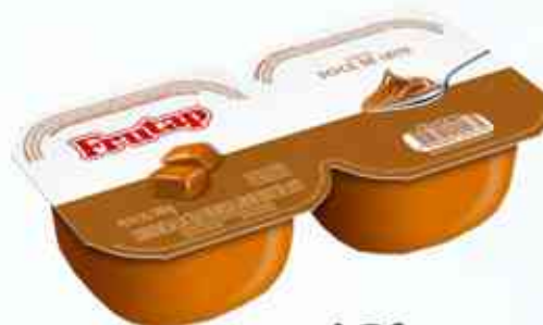
180g Doce de Leite