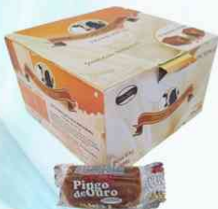
Tradicional 400g (40 unidades)