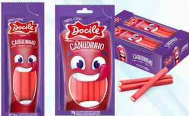
15g 70g Morango