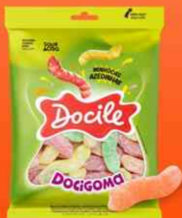
DOCIGOMA Minhocas Azedinhas