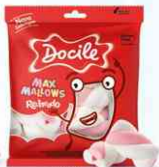
50g Twist Rosa e Branco