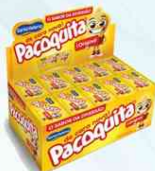
1Kg (50 unidades) Paçoca Quadrada