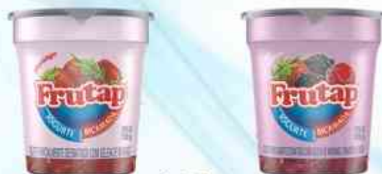
120g Morango - Frutas Vermelhas