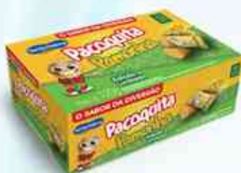
120g (8 unidades) Paçoca Rolha - Pamonha