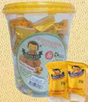
750g - 1,5kg Paçoca Rolha Pote - Caixa