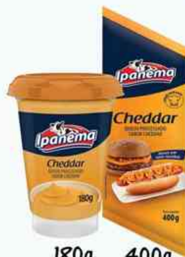
180g 400g Cheddar