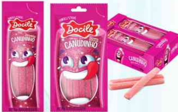
15g 70g Tutti - Frutti Cítrico