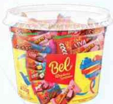
450g Bombons Sortidos - Pote