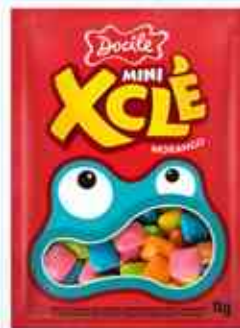
11g Mini Morango