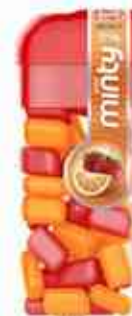
14g Laranja e Morango