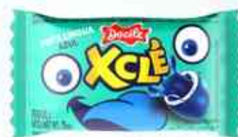
5g Pinta Língua Azul