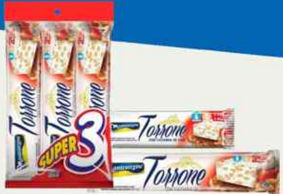
270g 45g 90g Castanha de Cajú