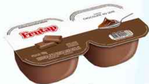
180g Chocolate ao Leite