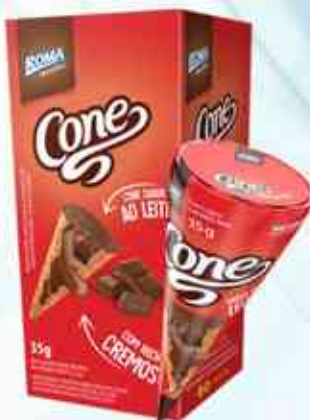
35g Ao Leite