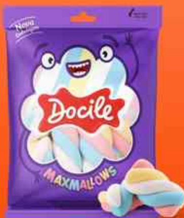
MAXMALLOW Twist Color I