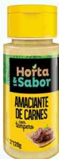
120g Amaciante de Carnes