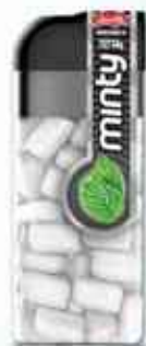
14g Hortelã Extra Forte