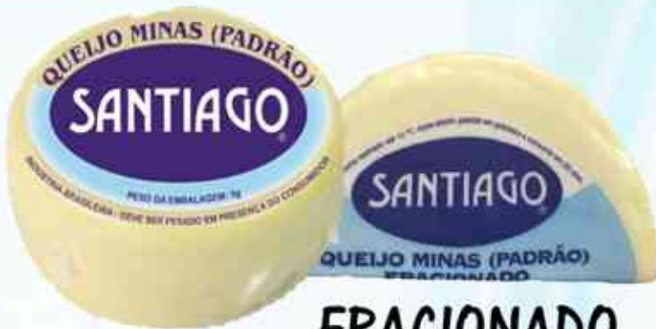
500g Minas Padrão