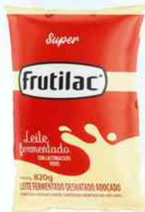
820g Super - Frutilac