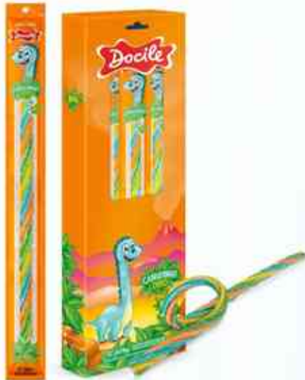
26g Big Dino