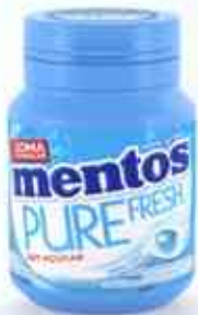
56g Garrafa Mint