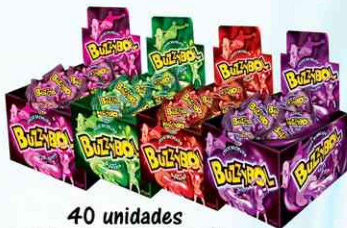
40 unidades Tutti - Frutti - Hortelã Morango - Uva