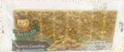
360g Paçoca - Tablete