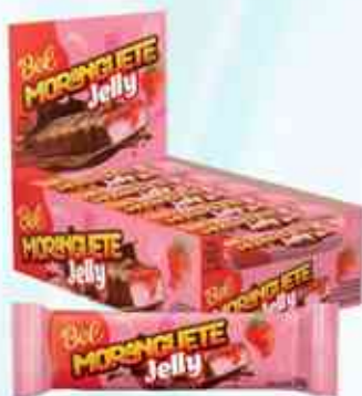
30g Moranguete Jelly