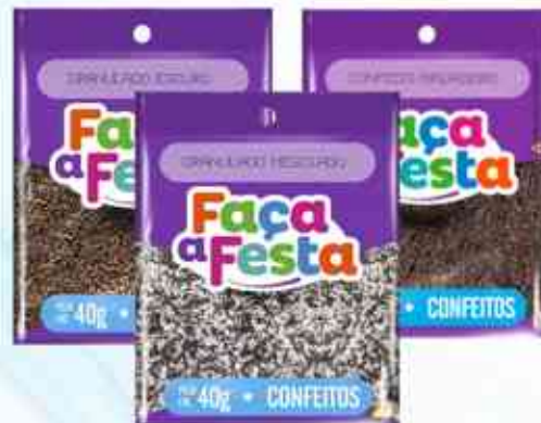
40g Granulado - Mesclado - Brigadeiro