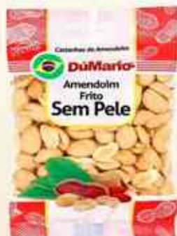
50g - 150g Sem Pele