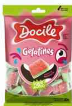
80g Pedacos Cítricos de Melância