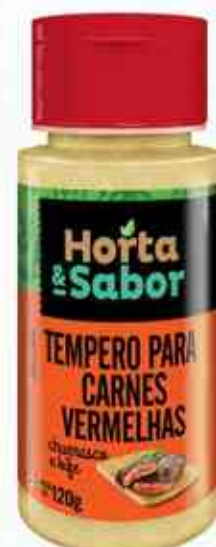
120g Tempero para Carne