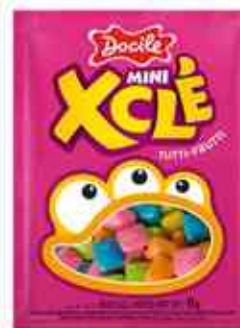
11g Mini Tutti - Frutti