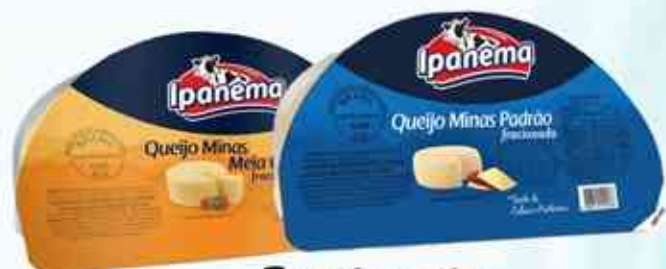
Fracionado Minas Meia Cura - Minas Padrão