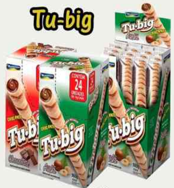
360g Chocolate - Avelã