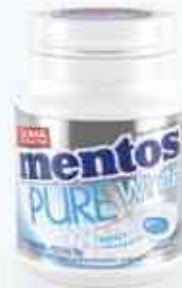
56g Garrafa White