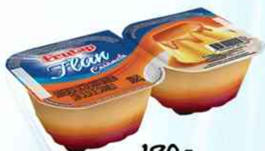
180g Flan de Caramelo