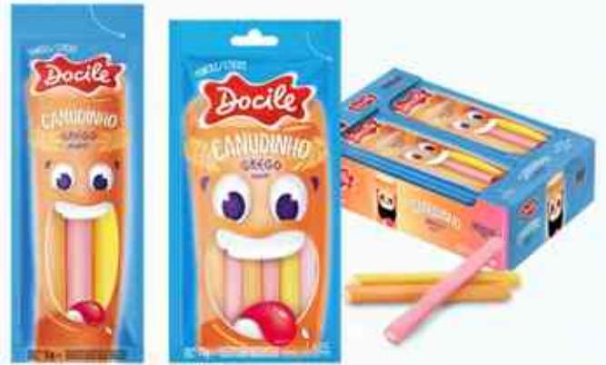
15g 70g Grego