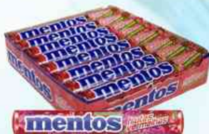
37,5g Frutas Vermelhas