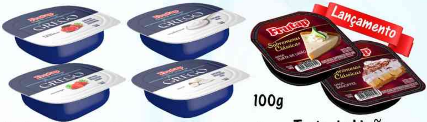
Geléia de Frutas Vermelhas - Tradicional Geléia de Coco - Geléia de Morango