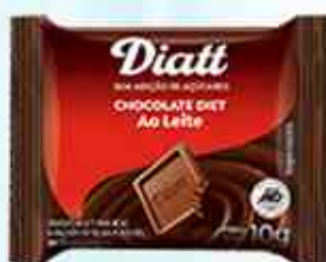
Tablete Mini - 10g Chocolate Ao Leite