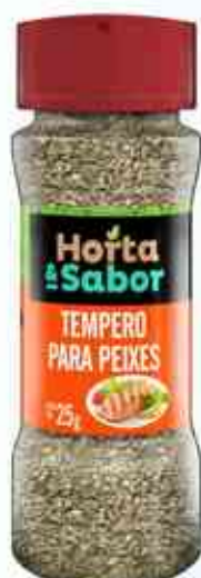
25g Tempero para Peixe